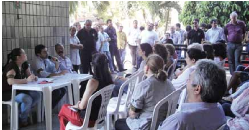
Ao contrário do que aconteceu em assembleias anteriores, na última poucos servidores apareceram

E m Assembleia Geral Extraordinária da categoria, realizada, no último dia 3 de agosto, no Fórum, TRT e para servidores da área metropolitana, foi definido, por unanimidade, que os servidores do TRT7 não realizarão nenhuma mobilização a favor do PL-6613 durante o mês de agosto. Os servidores aguardarão os resultados das mobilizações que serão realizadas neste mês em Brasília. A decisão de não realizar mobilizações foi o número de servidores que compareceu às Assembleias do Fórum (34) e TRT(18). Ficou claro o desinteresse da categoria, e que não havia número de servidores suficiente para decidir pelas mobilizações. Uma nova Assembleia será realizada