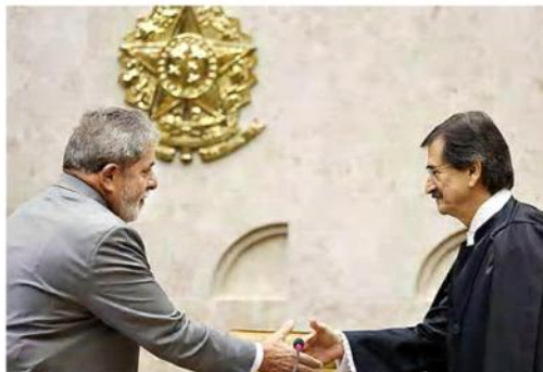
Só há alguma possibilidade de o projeto ser votado se o presidente do STF negociar diretamente com a Presidência da República.