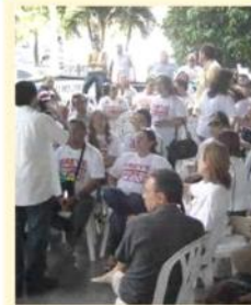
RETROSPECTIVA 2010 - Os desafios e as ameaças de um ano que ainda está longe de terminar (pag. 03)