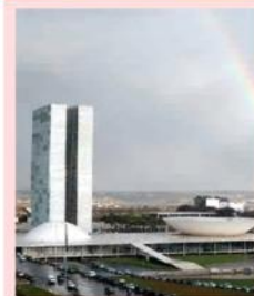
NOVA AMEAÇA- Projeto de Lei ameaça congelar salário dos servidores públicos (pág. 04)